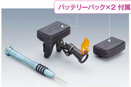
バッテリーパック×2 付属