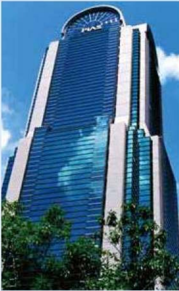
ピアスグループ 梅田本社オフィス 大阪市北区豊崎3-19-3 ピアスタワー

ウエルテックは、 美容と健康の分野で幅広く事業を展開する ピアスグループのネットワークを生かし、 医療分野で役立つ製品をお届けしています。