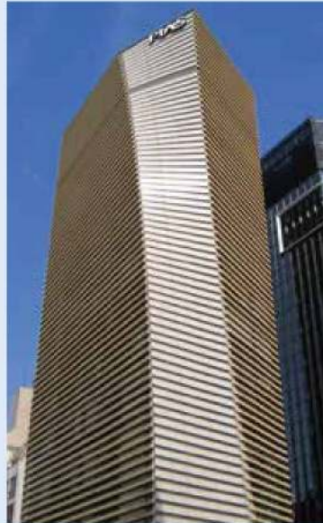
ピアスグループ 銀座オフィス 東京都中央区銀座4-8-10 PIAS GINZA

歯科医院・歯科関係の大学病院などで、予防歯科に着目した「コンクールブランド」を幅広く展開し、おかげさまで代表製品「コンクールF」は歯科でのシェアNo.1 ※ と、ご好評をいただいております。これからも歯科学的アプローチに基づいた製品を通して、医療分野に貢献して参ります。