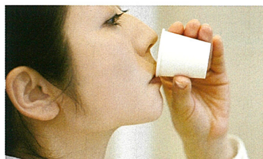
「10秒間、軽く洗口する」