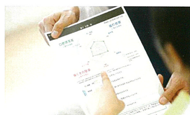
「測定結果を患者さんと共有」

SMTは3ステップの簡単操作で、測定時間はわずか5分。しかも一度の検査で6項目を測定。手間も時間もかけずに患者さんの「お口の健康状態」を測定できます。