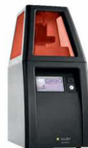
カーラ プリント 4.0

歯科咬合スプリント製作用の造形用インクです。 専用の3Dプリンター「カーラ プリント 4.0」で 造形することが可能です。