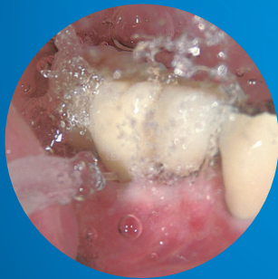
毎分1,200回の脈動水流