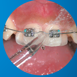
ジェットチップを歯間部に 垂直に当て清掃