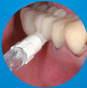
歯列矯正用チップで清掃