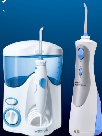
ウォーターピック®ウルトラ