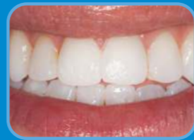
エナメラスト塗布後