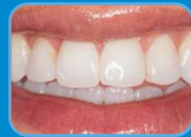
エナメラスト塗布前