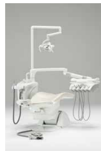
写真はオプション装備例