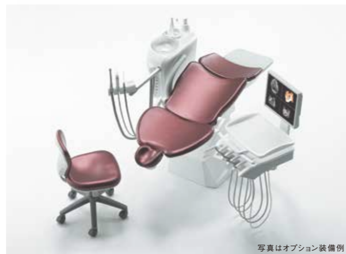
写真はオプション装備例

正面配置左右ハンドルで、どの診療ポジションでもテーブル移動が容易に行えます。無理な体勢で治療をしなくて済むので術者に無駄なストレスを与えることなく、より精度の高い治療を実現できます。