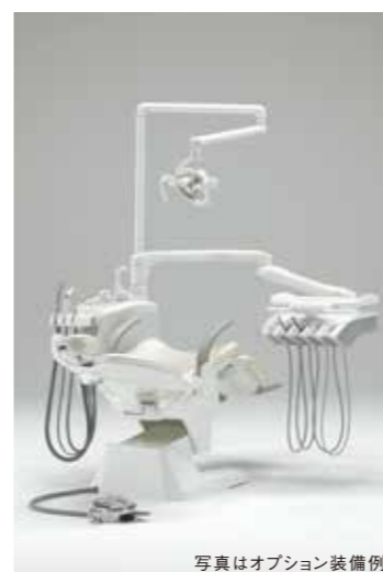
写真はオプション装備例