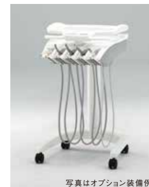
写真はオプション装備例