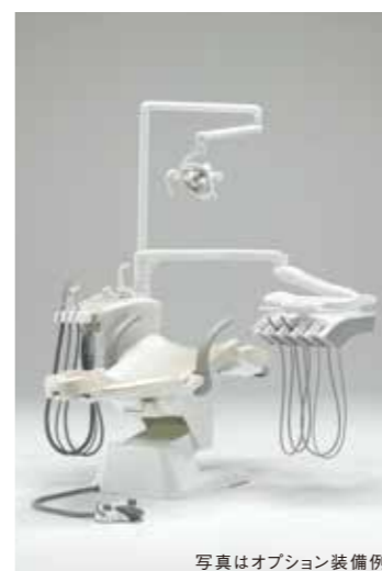
写真はオプション装備例