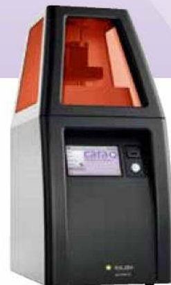
カーラ プリント 4.0

歯科咬合スプリント製作用の造形用インクです。 専用の3Dプリンター「カーラ プリント 4.0」で 造形することが可能です。