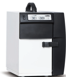
Z1 ECO PRO