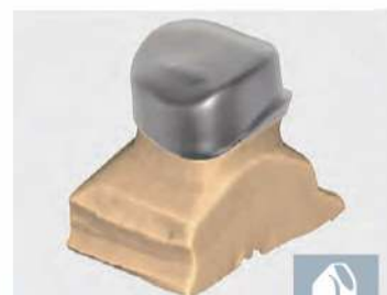
テレスコープクラウン

インレー、カンチレバー、メリーランドブリッジを含むフルクラウンのブリッジおよびフレームワークを設計できます。