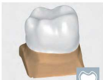
カットバック・オフセットコーピング

最小限の労力で美しく機能的なクラウンを設計できます。高品質の歯牙ライブラリを複数内蔵しています。