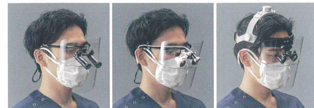
アイシールド(ルーベ用)

ルーベとの併用が難しかったフェイスシールドを使った飛沫対策が可能になります。曇り、反射、ゆがみなどの視界不良に繋がる併用時の課題を解決し、かつ幅広いルーベの仕様に対応した設計です。