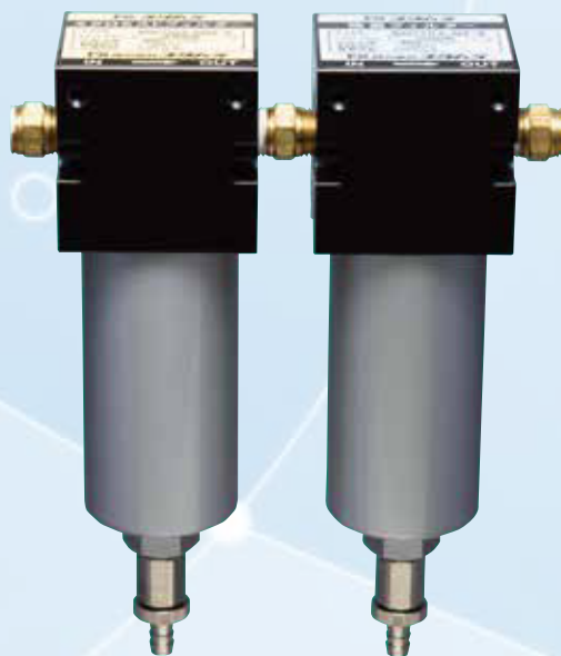
マイクロミストフィルター 除菌フィルター