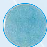
ろ過後 1個以下の菌