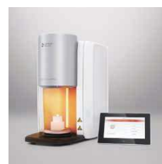
チェアサイドファーンズ CEREC SpeedFire

**CEREC MCXLとCEREC Primemillの平均削り出し時間と、メーカーから報告された焼成時間に基づいて比較しています。