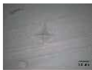
760°C*で2分間焼成後の表面 *CEREC Tesseractの焼成温度