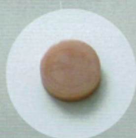
ティッシュューピンク ガム色