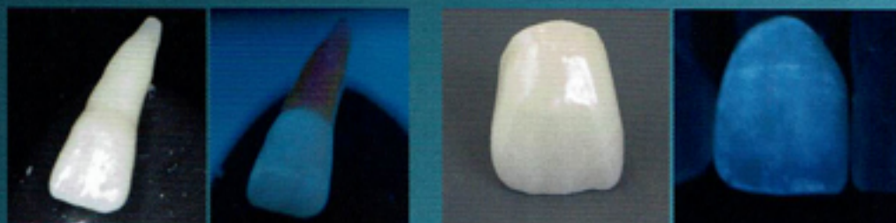
ブラックライト下での蛍光性を比較