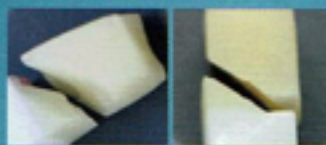
A: Zラスター使用 B: Zラスター未使用

※写真はポーセレンとジルコニアの四角柱の間に、Zラスターを塗付した物(A)と塗付していない物(B)です。Zラスターを塗付した部分は破折していません。