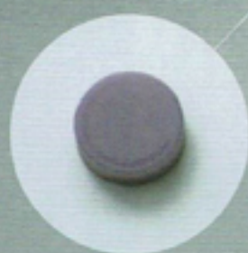
バイオレット 深い透明感