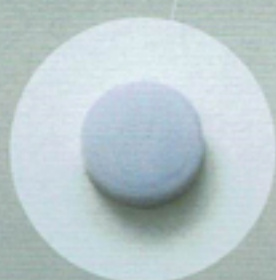
ブルーグレー 青みがかった透明感