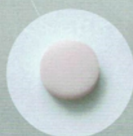
チェリーピンク レッドシフト