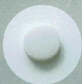
トランスグレー 明度を下げる