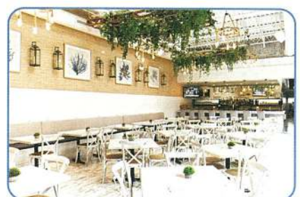
飲食店 接客・スタッフの体調管理