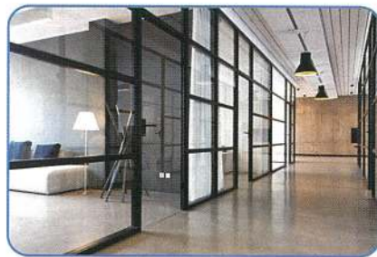
オフィスビル・テナント 出社・退社時のスタッフの検温・体調管理