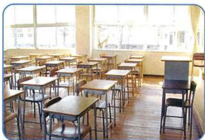
学校 学生たちの体調管理