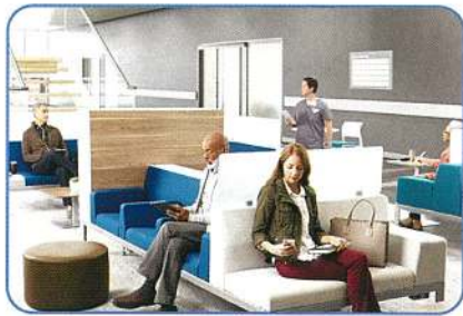
医療機関受付(病院) 検温とマスク着用の確認

多くの人が集まる、公共交通機関や医療機関、学校、商業施設、オフィスビル、飲食店、スーパーマーケットなど 検温と顔認証を非接触でスムーズに行うことができ感染症予防に役立ちます。