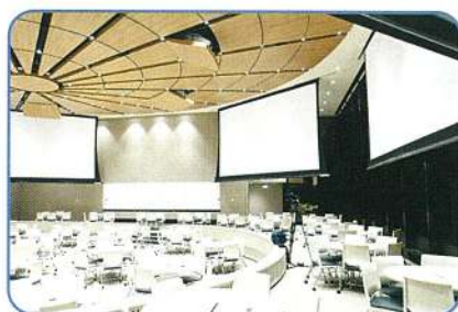
イベント会場 入場確認時の検温を実施