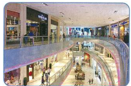
商業施設・スーパーマーケット お客様の入場前に検温・ケア