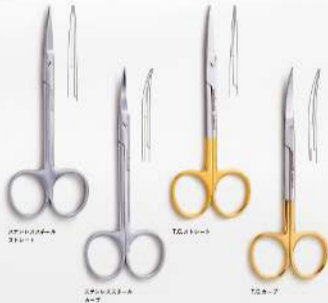
ステンレススチール ストレート