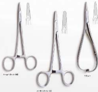
ニードルホルダー 140