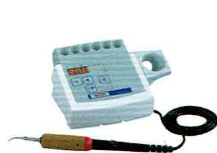
ワックスレトリック I

一般的名称:歯科用ワックス形成器 医療機器分類:一般医療機器 届出番号:1382X10104030339