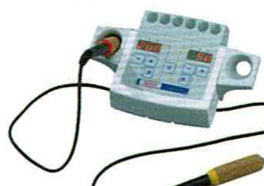
ワックスレトリック II

一般的名称:歯科用ワックス形成器 医療機器分類:一般医療機器 届出番号:1382X10104030339