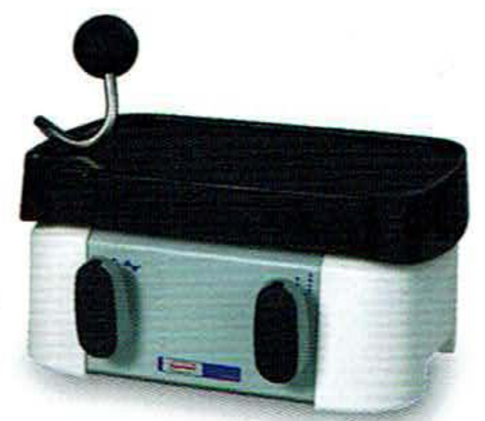
バイブレーションボール装着例