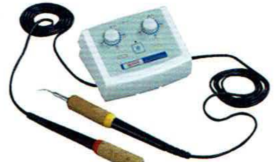
ワックスレトリック ライトII

一般的名称:歯科用ワックス形成器 医療機器分類:一般医療機器 届出番号:1382X10104030340