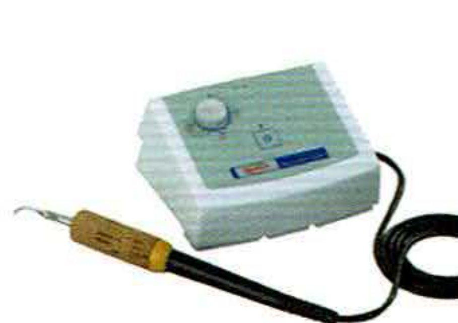
ワックスレトリック ライトI

一般的名称:歯科用ワックス形成器 医療機器分類:一般医療機器 届出番号:1382X10104030185