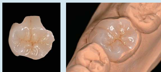
色調：A3 (ヴィンテージ アート ユニバーサルにてステイン)