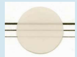
松風ディスクZR ルーセント FA 色調：5Lライト(A2相当) 厚さ：0.5mm