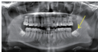
下顎左側の埋伏智歯

インプラントモーターとストレートハンドピース、コントラハンドピースにより埋伏智歯の抜歯が効率良く行え、気腫のリスクも低減できます。