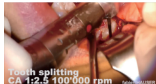
コントラハンドピースで歯冠を分割