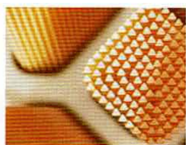
トライアングルカット