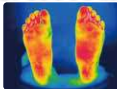
天空を1時間履いた後

地方独立行政法人 大阪産業技術研究所 に於いての サーモグラフィ試験 〈被験者：二十代女性〉