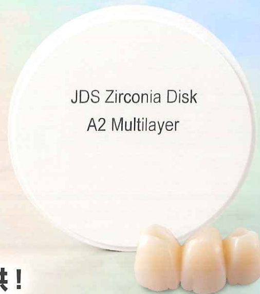
JDS Zirconia Disk A2 Multilayer