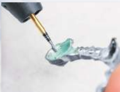
H73SHAX-014 クラウンの内面修正