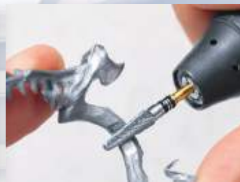
H79SHAX-040 金属床の形態修正