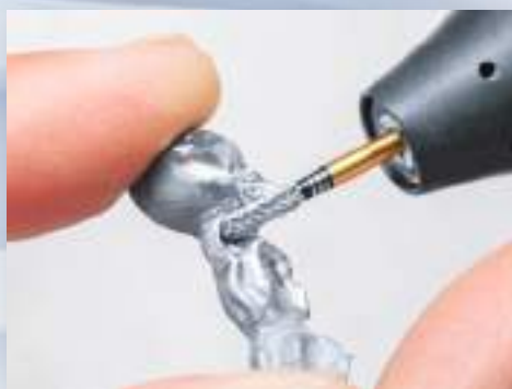
H129SHAX-023 クラウンブリッジの形態修正

ブレード一枚一枚の幅や深さに変化を与えたIntelligent Combination Design。これによりSHAXカッターは 従来品より高い切削力と高い耐久性を実現しました。