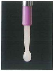
スーパーボンドEX ポリマー粉末 EXクリア