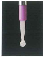
スーパーボンド ポリマー粉末 クリア

液なじみの良いポリマー粉末なので、ポリマー玉の採取が容易です。一度で大きなポリマー玉が採取できるため、筆積回数を減らすことも可能です。