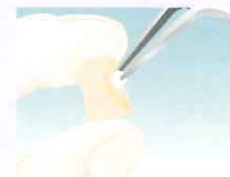
修復物に混合液を塗布