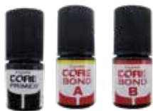
チャームコアプライマー (5mlボトル) 1本 チャームコアボンド A キャタリスト (5mlボトル) 1本 チャームコアボンド B ユニバーサル (5mlボトル) 1本