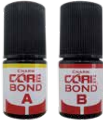
チャームコアボンド A キャタリスト (5mlボトル) チャームコアボンド B ユニバーサル (5mlボトル)