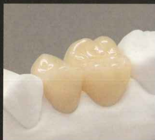
小白歯 (HCハードII) 大白歯 (HCスーパーハード)

松風ブロックHCハードIIと松風ブロックHCスーパーハード(大白歯部用)は同じ色調設計です。 これにより色調が調和し、2製品を併用する場合も変わらない感覚でお使いいただけます。