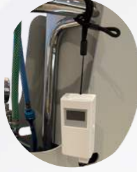
【06年架台】 【ストラップ使用】