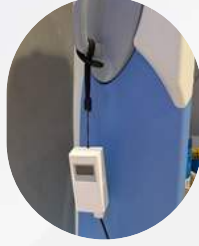
【12年架台】 【ストラップ使用】