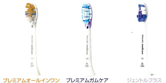
プレミアムオールインワン プレミアムガムケア ジェントルプラス