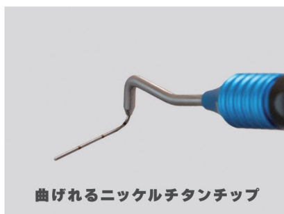
曲げれるニッケルチタンチップ

高コストパフォーマンス！ 好みのチップにカスタマイズ！ マイクロエンド、湾曲根管に